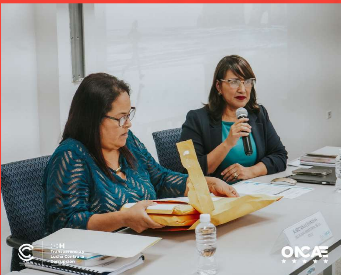
Apertura de Ofertas de la Compra Conjunta de Vehículos en ONCAE.

En el marco del control interno desde la ONCAE, se promueve la contratación mediante la compra conjunta donde se establece el procedimiento y mecanismo de compra eficiente, ágil y transparente para el sector público.