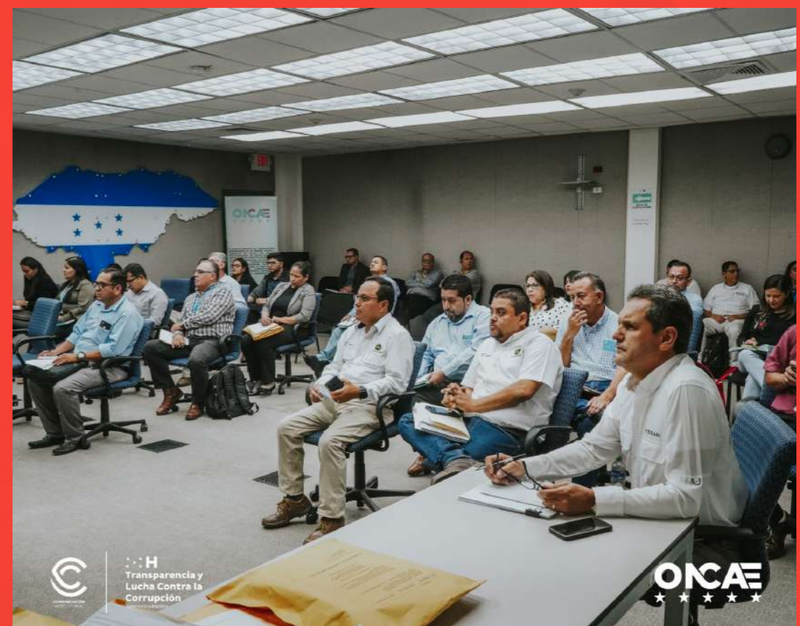
Apertura de Ofertas de la Compra Conjunta de Vehículos en ONCAE.